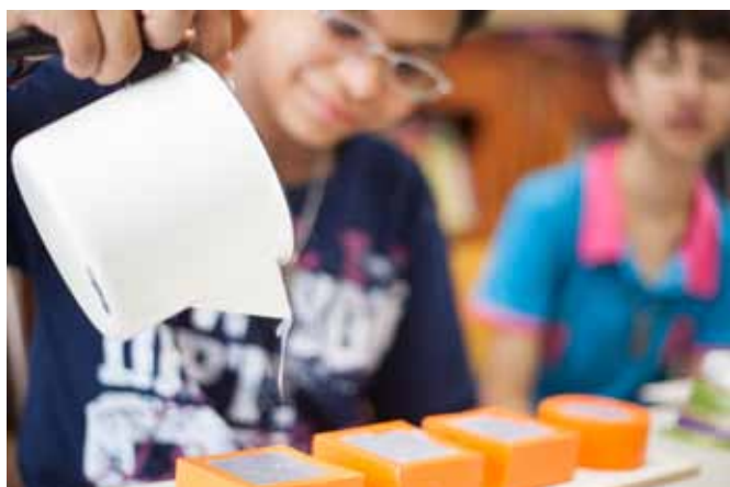
Adolescentes durante a produção de sabonetes na Unidade II da ACTC.

O Projeto Jovem Empreendedor teve início em maio de 2012 e, ao completar um ano, tinha capacitado para o mercado de trabalho mais de 50 adolescentes e jovens entre 12 e 24 anos. Trata-se de integrantes da atividade Adolescente Cultural e Reforço Escolar, na Unidade II da ACTC. A iniciativa interdisciplinar surgiu da necessidade de oferecer aos participantes possibilidades de desenvolver novas habilidades com cunho profissional, a fim de gerar renda própria nas cidades de origem.