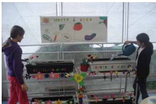
Diariamente as crianças cuidam e observam o crescimento das plantas.

No decorrer do mês, trabalhamos com atividades multidisciplinares, nas quais as crianças realizaram gráficos e tabelas dos alimentos e datas para plantio; estudaram a reprodução e partes das plantas; e ampliaram o conhecimento sobre os alimentos e seu valor nutricional, o que aguçou a vontade das crianças de se aprofundar no assunto e dar início à horta. Passaram então para a prática: plantaram, cuidaram e passaram a observar as primeiras folhinhas nascendo, fato que deixou todos ansiosos para ver o resultado.