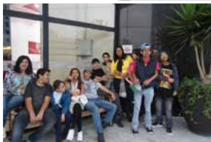
Cinema Shopping Eldorado.