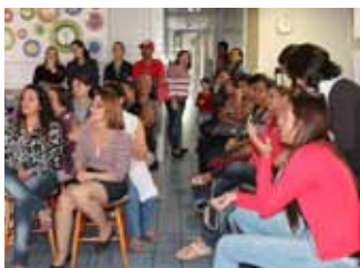
Mães/acompanhantes prestigiam as apresentações feitas pelas crianças e adolescentes (dir.). Logo após, também puderam saborear o lindo e saboroso bolo (esq.).

A data especial foi comemorada com presentes e uma homenagem.