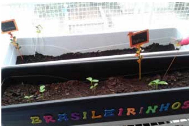
Canteiro com as plantas cultivadas na Atividade Brasileirinhos pelas crianças.