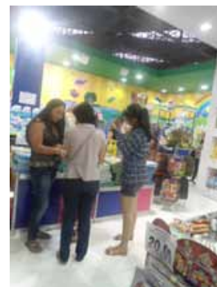
Bienal do Livro – Parque Anhembi