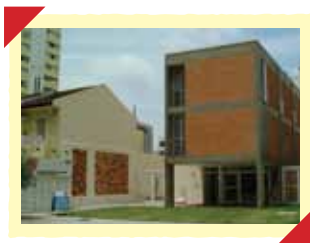
Fachada da sede da ACTC.

Nos meses de abril, maio e junho, recebemos muitas visitas, que vieram conhecer de perto as atividades e os trabalhos desenvolvidos pela ACTC. Agradecemos o interesse e aguardamos o retorno de todos.