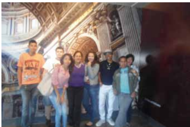
Grupo de jovens na exposição "Esplendores do Vaticano" na Oca – Parque do Ibirapuera.