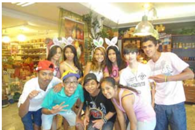
Jovens em visita ao Studio Peter Paiva

O grupo de jovens está entusiasmado com as perspectivas de futuro que o projeto proporciona e cada vez mais adolescentes querem iniciar a própria oficina.