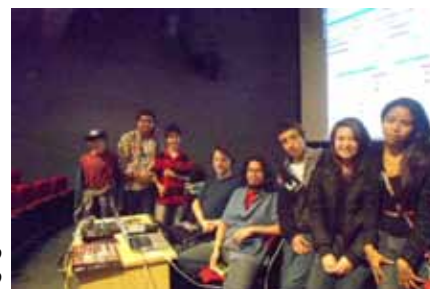
MAM – Parque do Ibirapuera – São Paulo