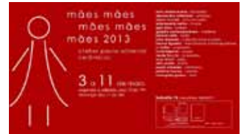
Convite de divulgação do bazar realizado pelo Atelier Paula Almeida.

Agradecemos de coração a oportunidade de divulgação e venda dos produtos bordados pelas mães/acompanhantes.