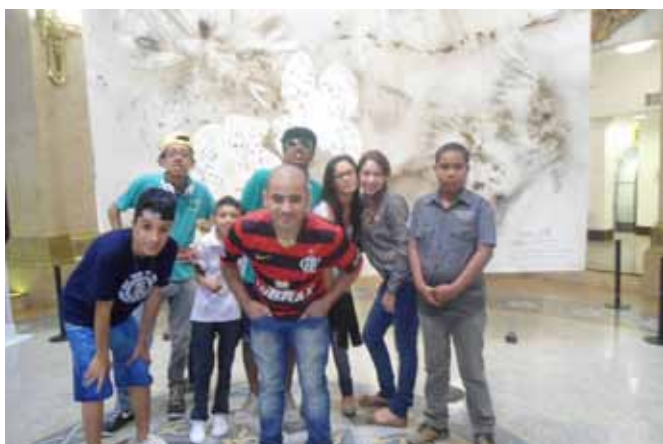
Exposição no Centro Cultural Banco do Brasil – Artista Plástico Cai Guo-Qiang.

A Atividade Cultural Externa acontece às quintas-feiras com o grupo de adolescentes participante do Adolescente Cultural. Esta atividade visa ao apoio ao adolescente da ACTC, oferecendo-lhe condições de lazer e bem-estar, ampliando seu universo cultural e social, proporcionando condições favoráveis ao desenvolvimento da autoconfiança e da cidadania e, ao mesmo tempo, possibilitando a continuidade de seu processo de aprendizagem.