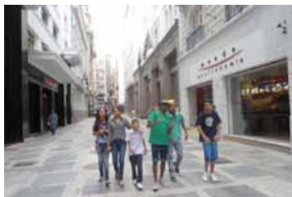
Visita ao prédio do Banespa – Centro de São Paulo.

Sempre acompanhado das educadoras, o grupo tem a oportunidade de ver na prática assuntos relacionados à atividade externa que são trazidos no decorrer da semana. É um momento produtivo e divertido, em que o aprender se torna dinâmico, vivo.