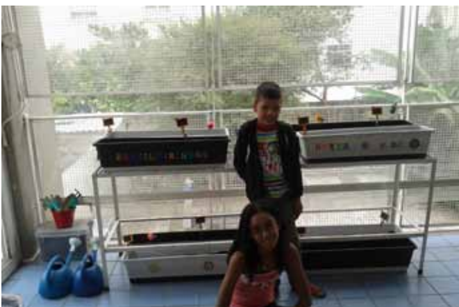
Esse projeto pretende despertar a percepção das crianças no cuidar e trabalhar a paciência e perseverança.

Com o projeto pretendemos desenvolver habilidades que permitem às crianças descobrir, produzir, selecionar e consumir os alimentos de forma adequada, segura e saudável. Os conhecimentos adquiridos serão transmitidos pelas crianças aos adultos e a todas as pessoas com que tenham contato.