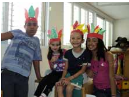
Crianças caracterizadas com itens indígenas para comemorar o Dia do Índio.

Datas comemorativas são abordadas com as crianças.